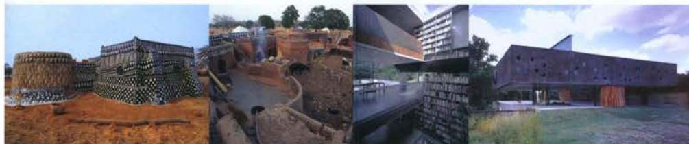
Vivienda Kasena en un poblado. Burkina Faso, África